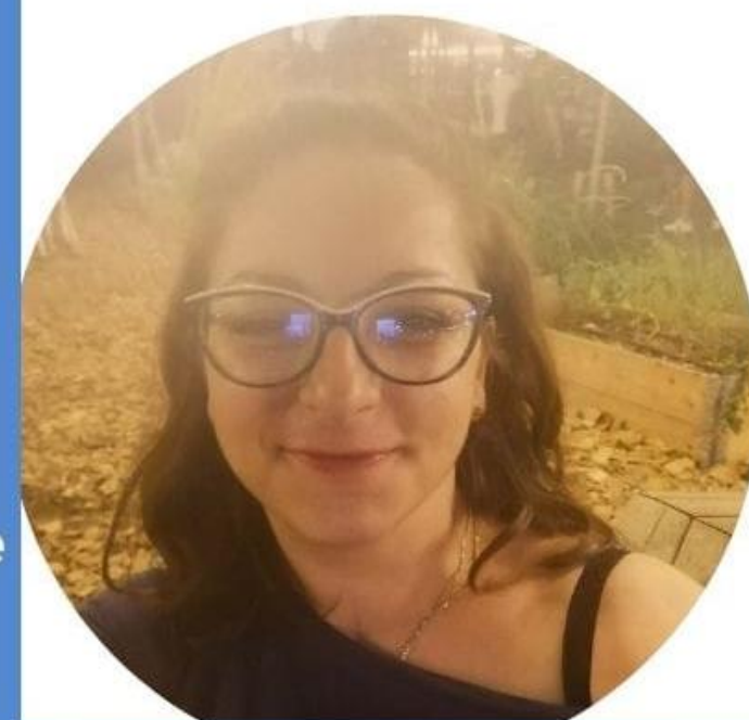
MARIAPINA BALESTRA SCUOLA SECONDARIA DI PRIMO GRADO

È necessario che la scuola riprenda la sua centralità nella società contemporanea e che riacquisti il suo valore. Noi ci impegniamo perché ciò avvenga.