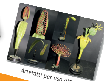
Artefatti per uso didattico