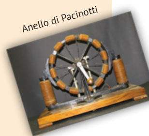
Anello di Pacinotti